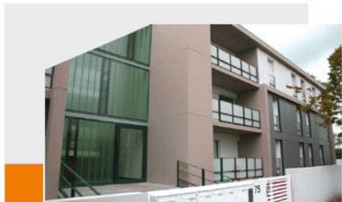
Le Péséou Résidence de 30 logements