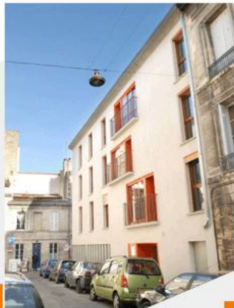
InCité Construction de logements